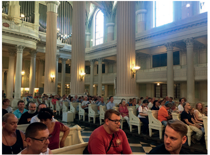
Auch viele Besucher der Messestadt nahmen an diesem Friedensgebet teil.